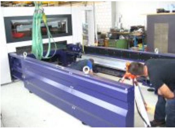
Montaža sklopa mašine za lasersko sečenje Zoom