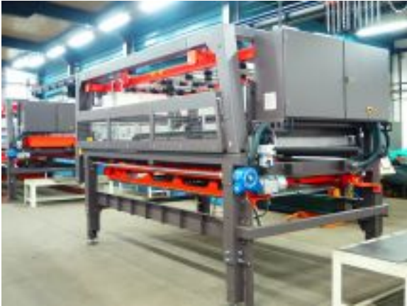
Bystronic ByTrans - montirana mašina Zoom