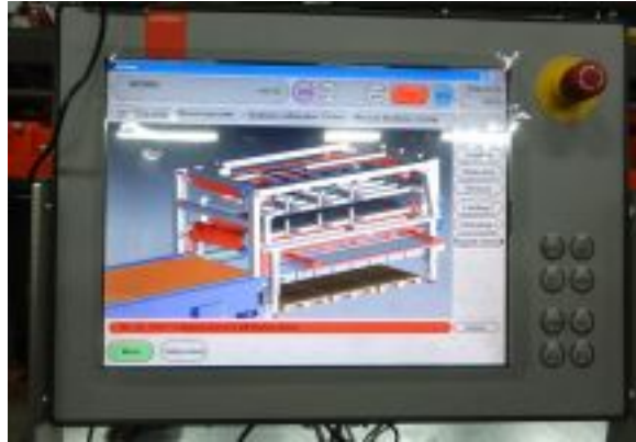
Bystronic ByTrans - CNC upravljački sistem Zoom