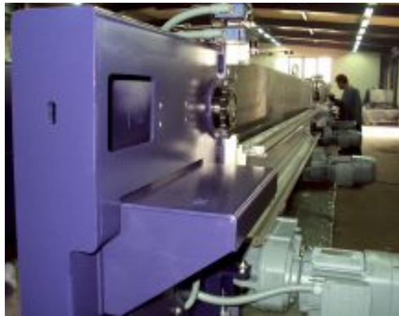
Montaža sistema za izmenu limova Zoom