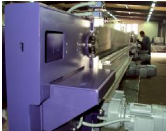
Montaža sistema za izmenu limova Zoom