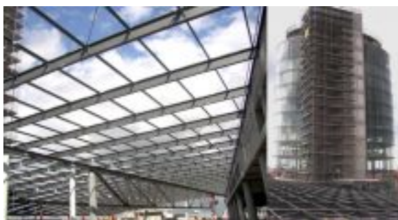
DaimlerChrysler AG, Nova Filajala München, isporuka i montaža 1200 t, zavarene konstrukcije