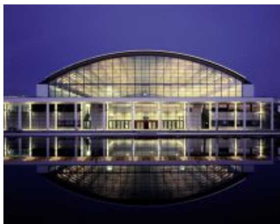
Novo sajmište, Friedrichshafen, 2002.