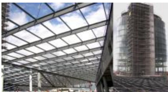
DaimlerChrysler AG, Nova Filajala München, isporuka i montaža 1200 t, zavarene konstrukcije